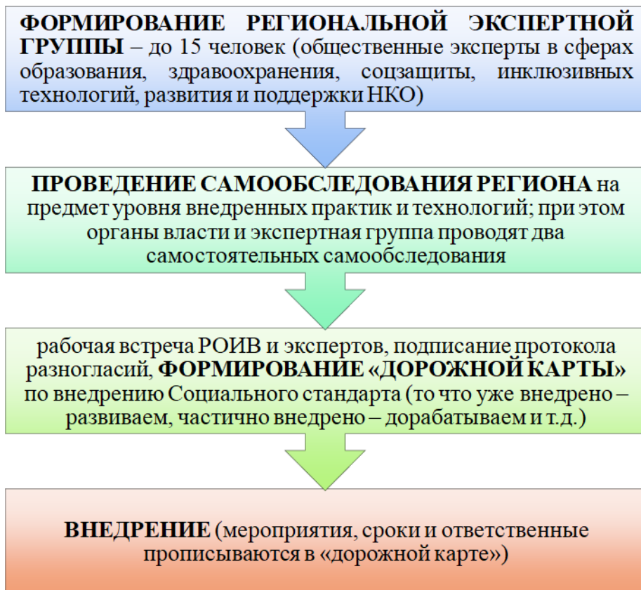
СХЕМА ВНЕДРЕНИЯ СОЦИАЛЬНОГО СТАНДАРТА