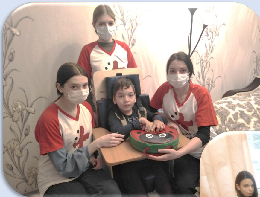
Развиваем моторику в играх