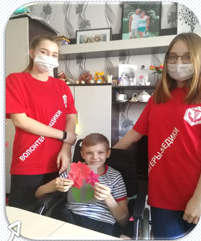
Готовим подарок бабушке