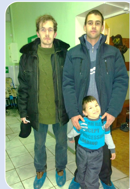
Сопровождение на мероприятия и реабилитацию