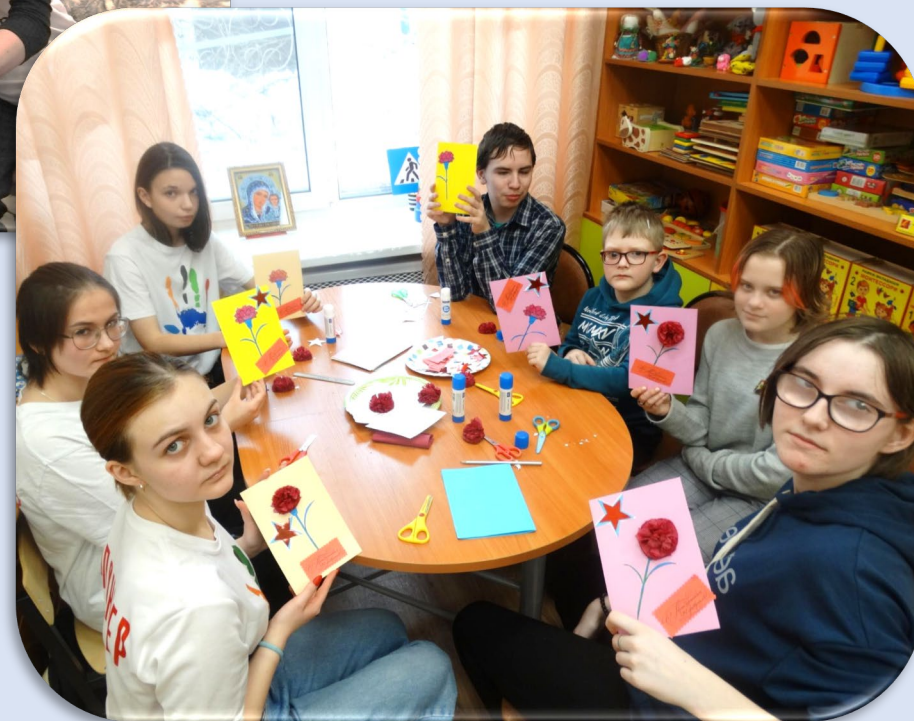
Поделки к празднику