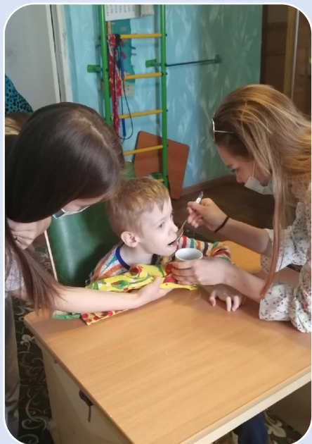
Практика «Социальная няня»