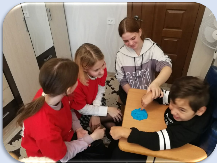
Новые встречи с друзьями