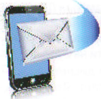
Мобильный телефон (SMS)